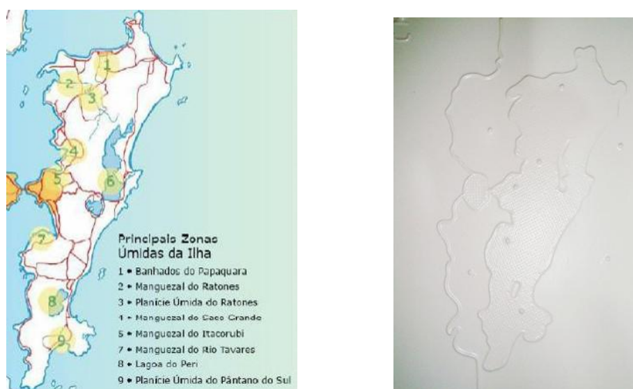
Figura 1 – Mapa em tinta e Mapa Tátil representando as Zonas úmidas na Ilha de Santa Catarina

A figura 1 representa os ambientes úmidos da ilha de Santa Catarina, com o modelo em tinta e o mapa tátil, a figura 2 apresenta o desenho da trilha do Rio do Brás, a matriz e o mapa tátil pronto, demonstrando as três etapas do processo de confecção do mapa tátil.