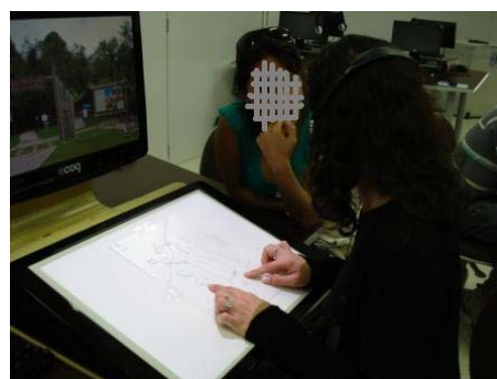
Figuras 4, 5, 6 e 7 - Momento de testes cognoscíveis com invisuais, para os mapas táteis da trilha do Rio do Brás.