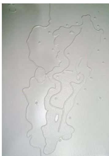
Figura 3 – Mapa Tátil representando a rede viária principal e as praias da Ilha de Santa Catarina.

As informações sobre o tema abordado nos mapas serão transmitidas à medida que os botões contidos nos mapas forem acionados, a cada toque novas informações são apresentadas. Em um mesmo botão poderão estar contidas diversas informações sobre o mesmo ambiente representado, sendo estes acionados de acordo com o interesse do usuário.