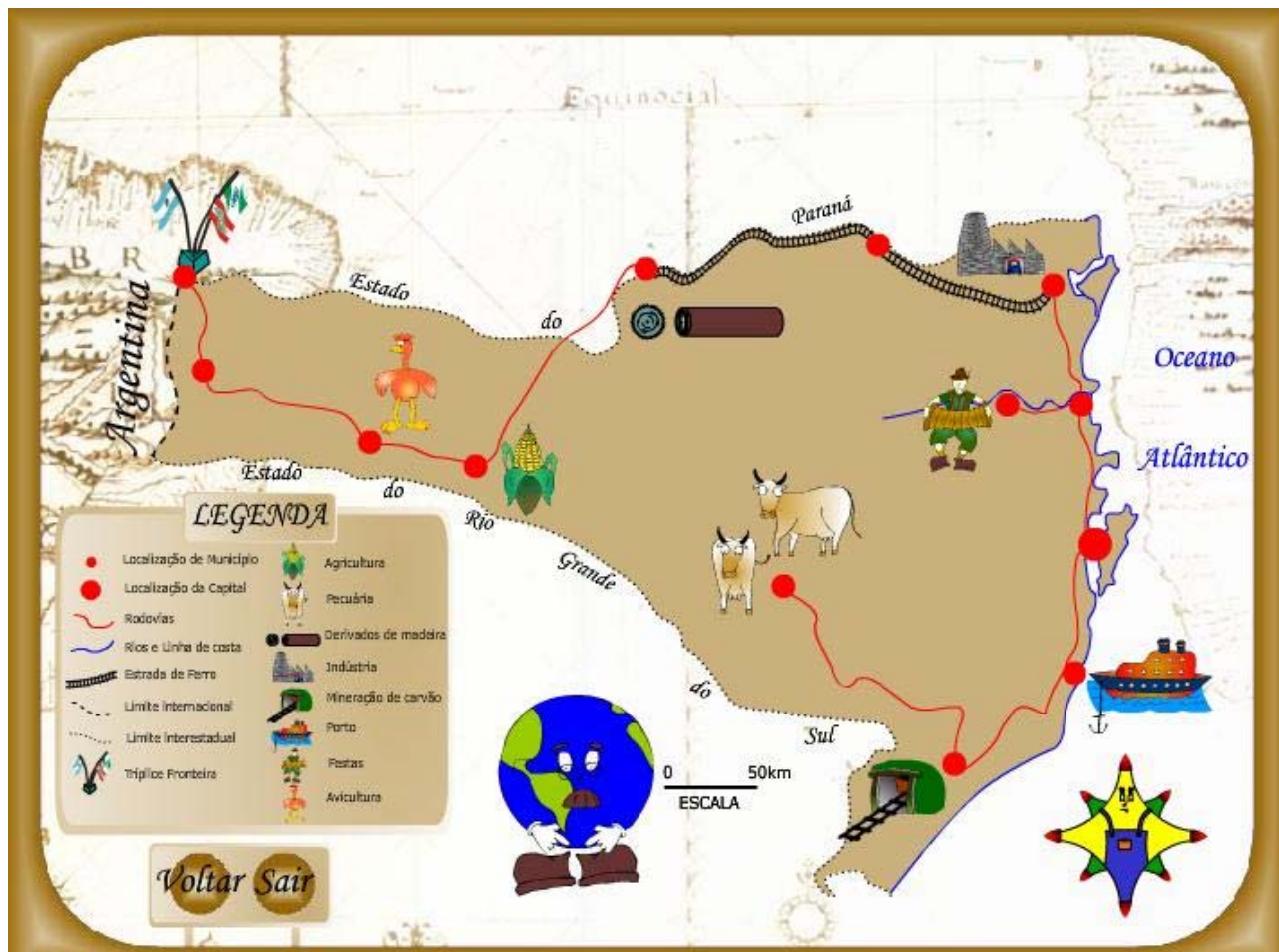
Fig. 4: Mapa final com a legenda completamente formada. Possibilita o acesso a todas as informações veiculadas no jogo.