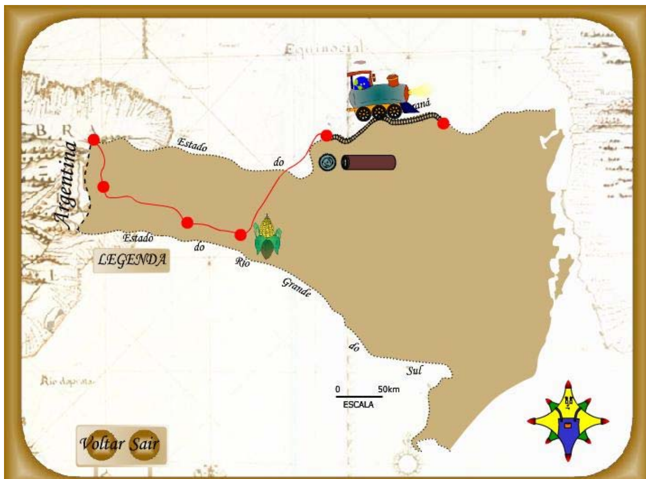
Fig. 3: Andamento linear da informação é instigado pelo personagem.

No jogo, foi priorizado o andamento linear da informação, pois o aluno primeiro deve acertar a pergunta relativa ao município que está a visitar para em seguida prosseguir para o próximo município no mapa e por isso alcançar o próximo nível. A interatividade se dá através do personagem Globinho , que instiga o aluno a clicar no mapa no ponto desejado. (Figura 3).